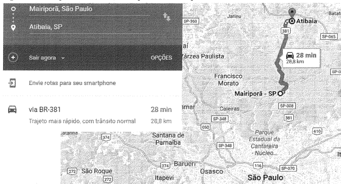
Figura 2 – Trajeto entre os municípios de Mairiporã e Atibaia